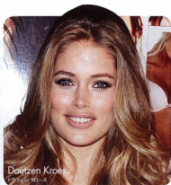
Doutzen Kroes ドゥーテン・クロース