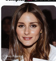
Olivia Palermo オリーブ・パルモ